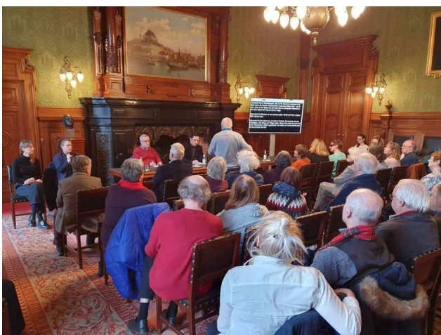
Blick in den Saal, Foto: Reinhard Schwandt

Für Dienstag, 24.01.2023, hatte Deniz die Seniorenbeiräte und die Seniorendelegierten aber auch aktive SeniorInnen aus den Gewerkschaften und unserer LAG SeniorInnenpolitik zum Brunch in den Bürgersaal im Rathaus geladen. Ungefähr