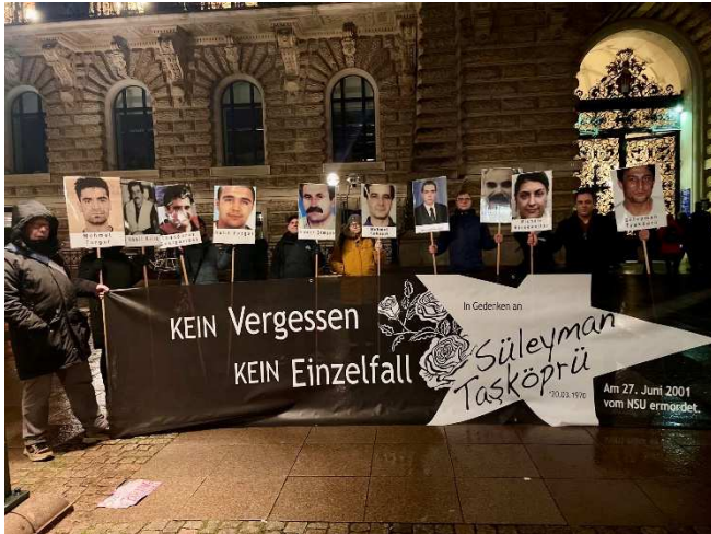
Mahnwache für die Opfer des NSU

Die Grünen hatten zum Neujahrsempfang eingeladen - und das Hamburger Bündnis gegen Rechts kam, wenn auch nicht ins Rathaus, sondern zu einer kleinen Kundgebung davor. Es ging darum, die Grünen an ihren über ein Jahr alten Beschluss zu einem Parlamentarischen Untersuchungsausschuss (PUA) zu rechten Netzwerken