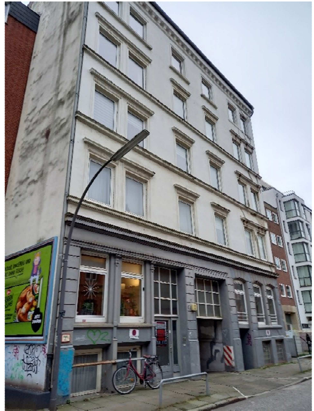
Brennerstraße 80/82

Und jetzt also auch noch der drohende Abriss des Wohnhauses Brennerstraße 80/82. Betroffen sind hier sieben Mietparteien überwiegend im höheren Alter und mit wenig Einkommen. Jahrzehntlang ist nach Angaben der MieterInnen keine Instandhaltung vorgenommen worden, jetzt drohen ein Abriss wegen „wirtschaftlicher Unzumutbarkeit“ und eine so genannte „Verwertungskündigung“. Einfacher gesagt: Weil die Mieten niedrig sind, der Standard der Wohnungen gering und der Zustand des Hauses als sanierungsbedürftig anzusehen ist, soll den Menschen einfach das Dach überm Kopf weggerissen werden, obwohl die SozErhaltVO ja gerade den Abriss günstigen Wohnraumes verhindern soll. Der Bezirk argumentiert, er müsse die Abrissgenehmigung erteilen, weil eine Sanierung zu teuer käme und dem Eigentümer der Erhalt des Hauses „wirtschaftlich nicht zumutbar“ sei – den MieterInnen aber wird alles zugemutet, vom Rauswurf nach Jahrzehnten, dem Verlust ihrer St. Georger Heimat bis hin zur drohenden Obdachlosigkeit.