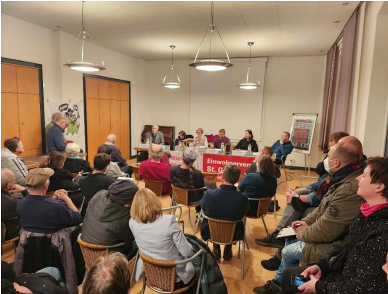
Blick in den Saal bei der Podiumsdiskussion