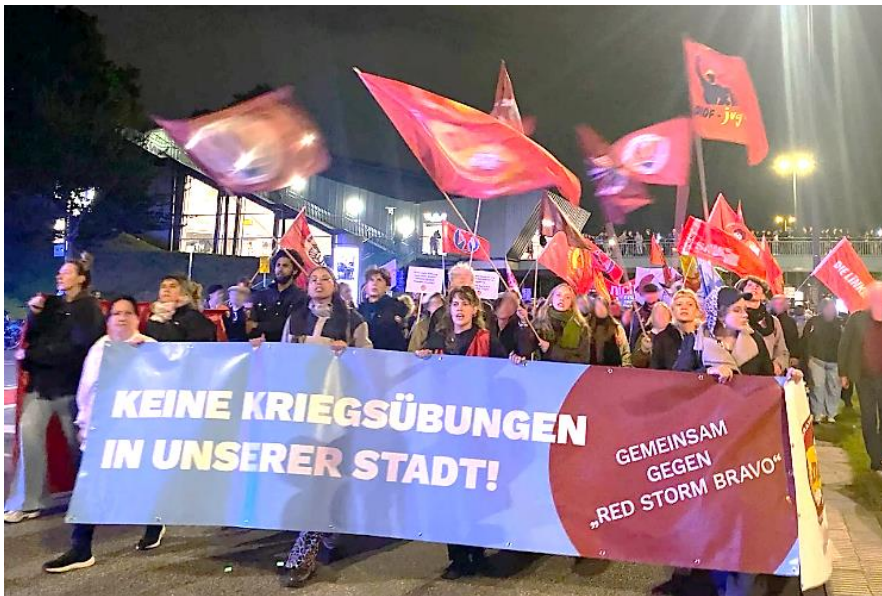
Das Fronttranspi, Foto: David Stoop

Um 18 Uhr ist dann der Platz mit 1.500 Teilnehmer*innen gefüllt.