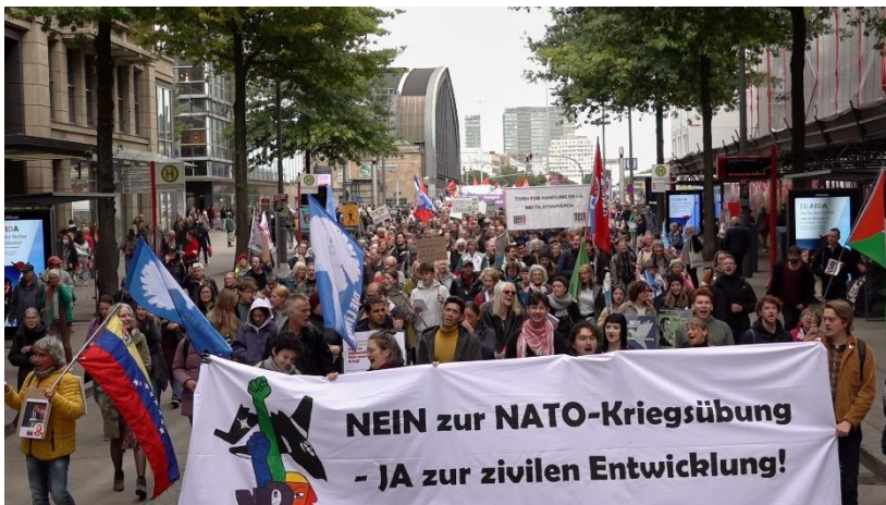
Die Demo auf der Mönckebergstraße

Mit dem NATO-Manöver vom 25.-27. September in Hamburg hat die Bundeswehr uns vor die Frage gestellt, inwieweit wir bereit wären einen NATO-geführten Krieg gegen Russland mitzumachen. Angesichts der großen friedens- und arbeiterbewegten Geschichte Hamburgs bedeutet dies, wenn das der NATO hier gelingt, gelingt es auch anderswo in der Bundesrepublik. Und andersrum heißt dies, wenn wir eine neue Offensivität der Friedensbewegung aufbauen und ein NEIN zu dem Manöver zum Ausdruck bringen, ist auch das bundesweit möglich – ausgehend von Hamburg. Das ist uns mit einer lebensfrohen und kämpferischen Friedensaktionswoche gut gelungen. Einen wichtigen Anteil daran hatten die Kundgebung „Hamburg pfeift aufs Militär“ am 25.09. und die Demonstration „Nein zur NATO Übung Red Storm Bravo – Ja zur zivilen Entwicklung“ am 27.09..