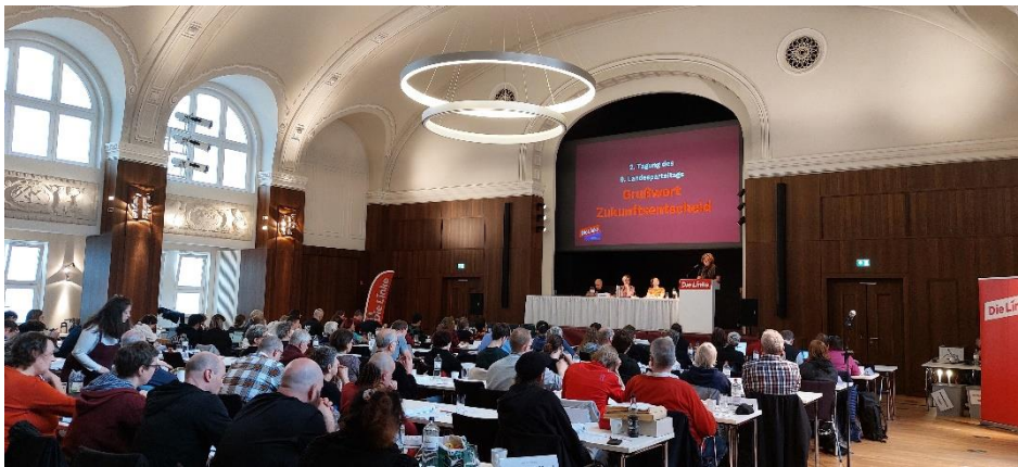
Blick in den Musiksaal beim Grußwort der Inj

Eingeklemmt zwischen den Demos gegen das NATO Manöver am Freitag und Samstag und dem Safe Abortion Day am Sonntag, hatten wir nur zwei halbe Tage Zeit für eine große Menge von Anträgen, die zeigen, wie lebendig und aktiv unsere Partei aktuell ist. Die gewachsene Mitgliedschaft zeigte sich auch an der großen Anzahl von Gästen: Von Beginn bis Ende waren neben den Delegierten bis zu 50 weitere Parteimitglieder anwesend, um am Parteitag teilzuhaben.