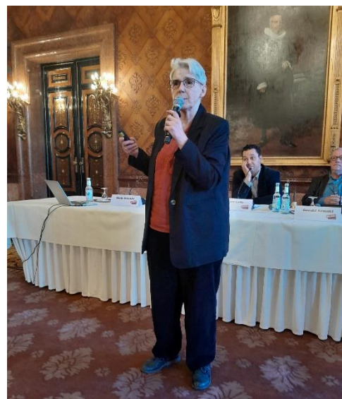
Sonja Kemnitz' Referat

Nur schade, dass die Veranstaltung wegen einer Folgeveranstaltung auf zwei Stunden begrenzt war, es hätte sicher noch Redebedarf gegeben.